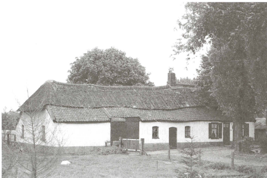
Afb. 3: Het geboortehuis van Martin Roestenburg in Acht (Woensel, Eindhoven), gebouwd in 1675 en gesloopt in 2003.