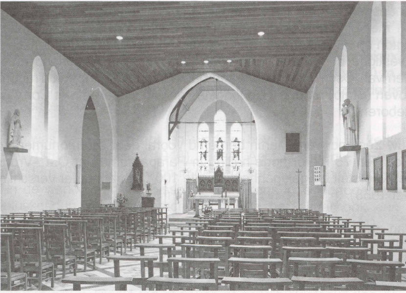
Afb. 6: Het kerkinterieur van Haasrode in 1975.