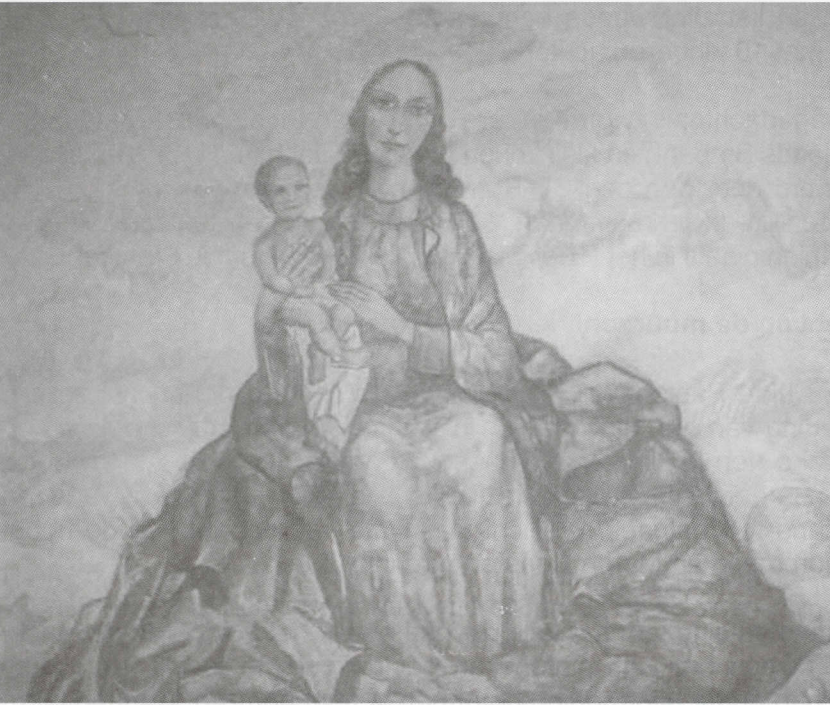
Afb. 7: 'De verborgene Madonna'.